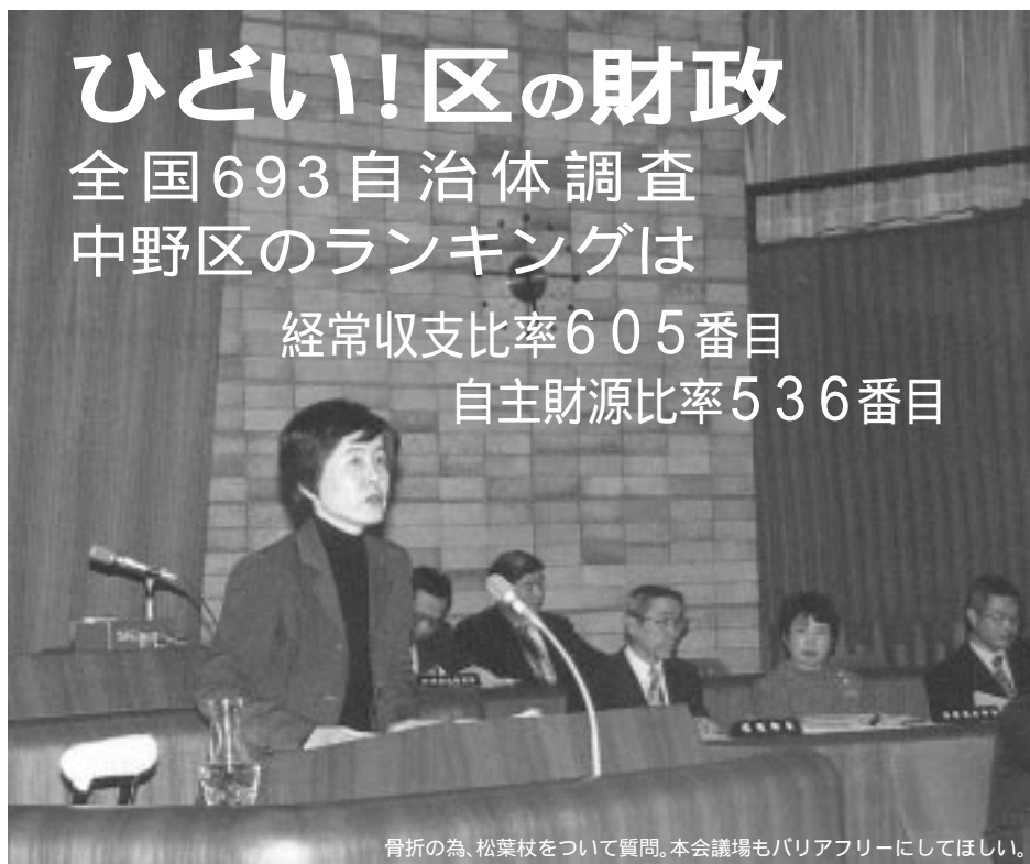
骨折の為、松葉杖について質問。本会議場もバリアフリーにしてほしい。

http://homepage2.nifty.com/usagidayori/ mail usagidayori@hotmail.com 編集:住民自治をすすめる会 発行:市民自治フォーラム